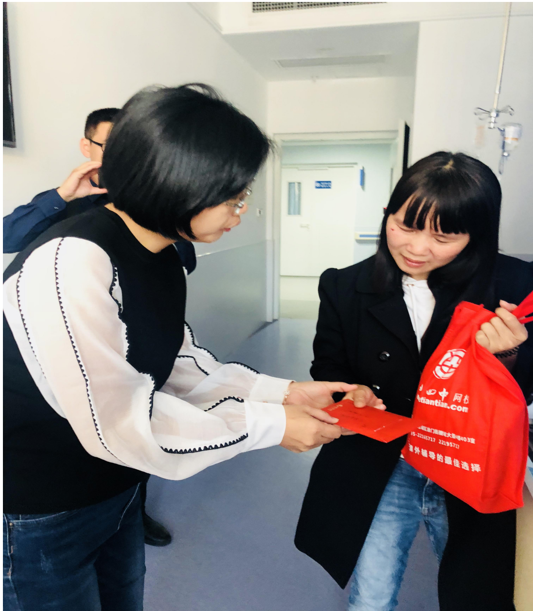
庄月芳校长亲自将善款交给校友的母亲