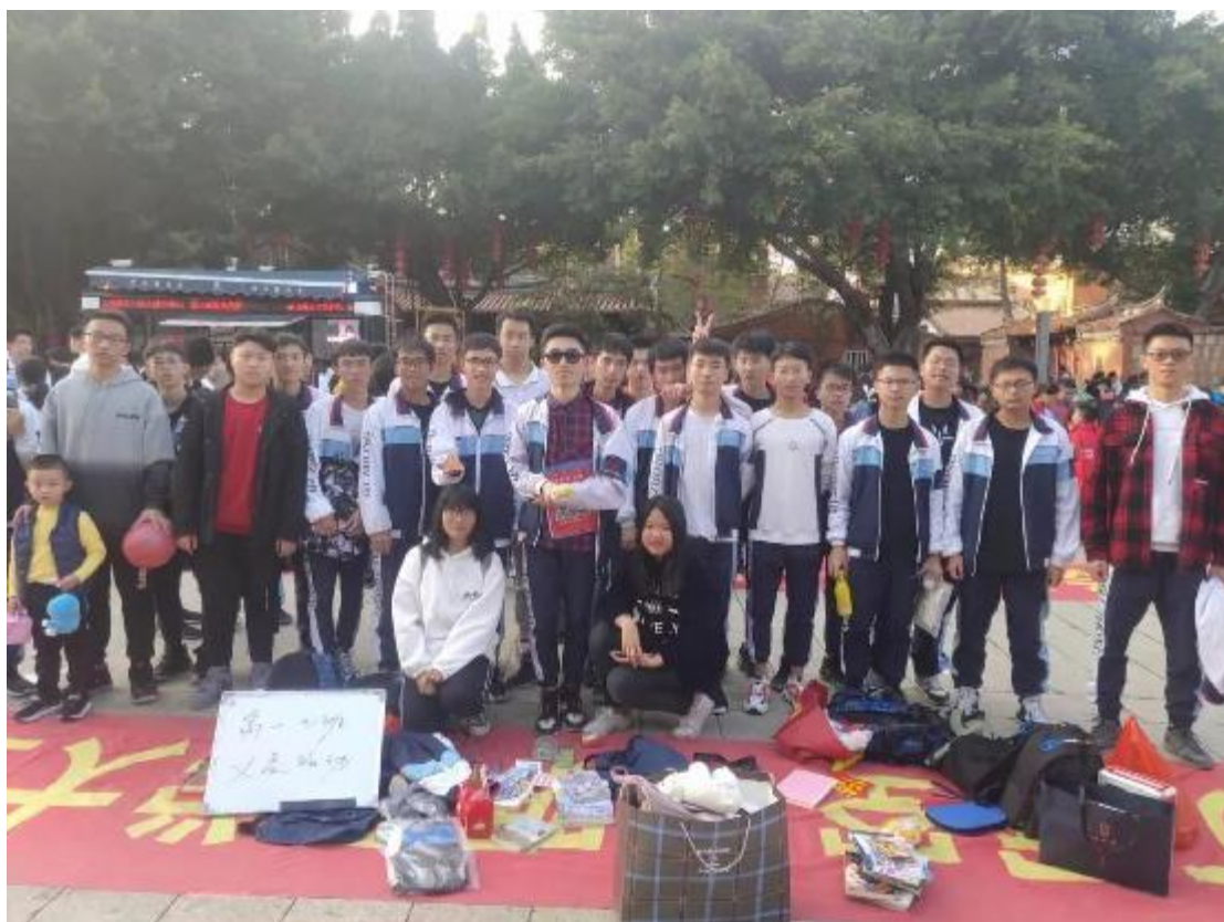
高二 7 班