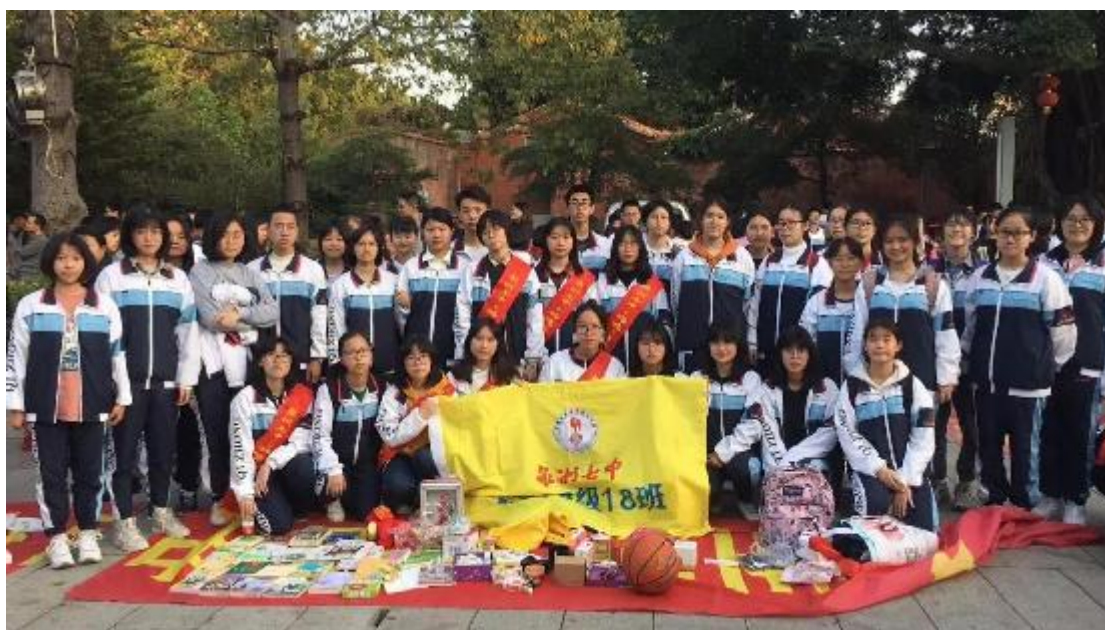
高二 18 班