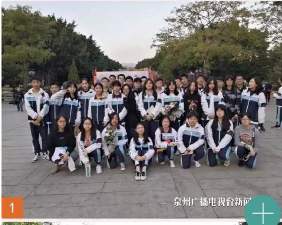
泉媒体”图片直播浏览量突破 30 万