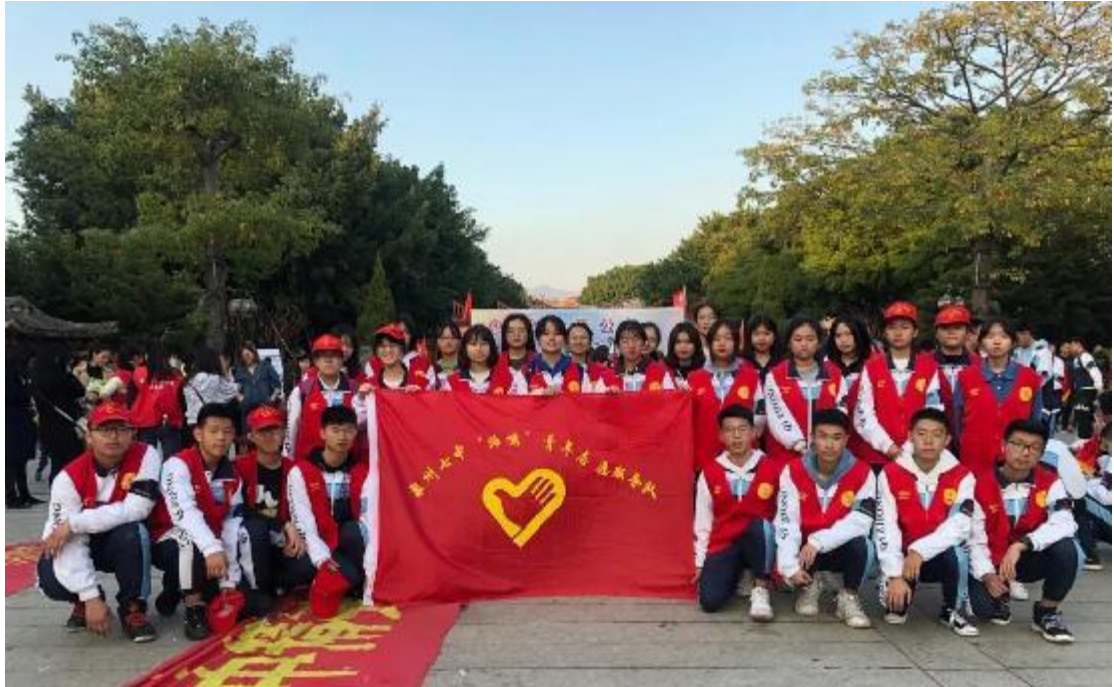
全体学生会工作人员合影

12月15日下午，我校“晦鸣”青年志愿服务队参加了由中共泉州市委文明办、泉州市教育局、泉州广播电视台、泉州市慈善总会、泉州市红十字会与泉州泉城公益团队共同策划组织的2019年“全是爱公益”第十五期义卖活动。本次活动由我校团委组织策划，高一1班、2班、4班、5班、15班、16班，高二：1班、3班、4班、7班、8班、9班、11班、12班、14班、18班、19班、中美班共18个班级的班主任、学生、家长以及全体学生会同学参与了此次义卖活动。活动得到泉州广播电视台新闻广角的官方微信号——“泉媒体”同步直播，浏览量突破30万。