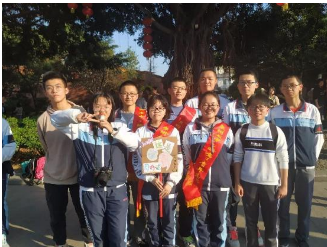
高二 1 班