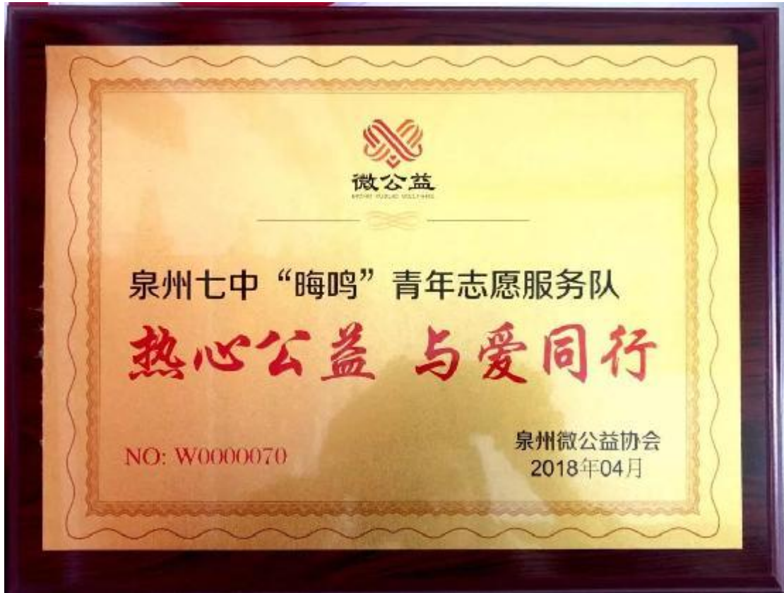
泉州七中“晦鸣”青年志愿服务队被授予“热心公益，与爱同行”称号