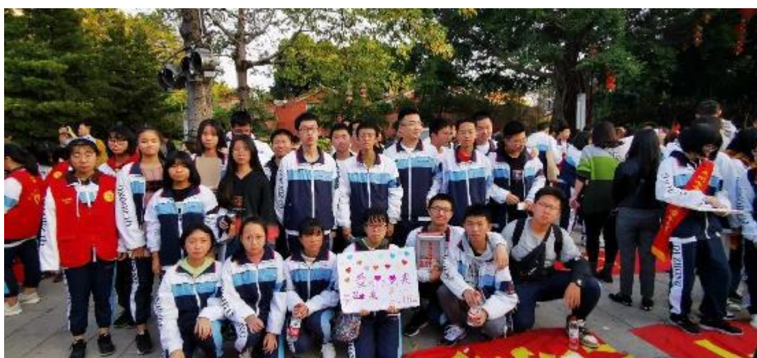
高一 2 班