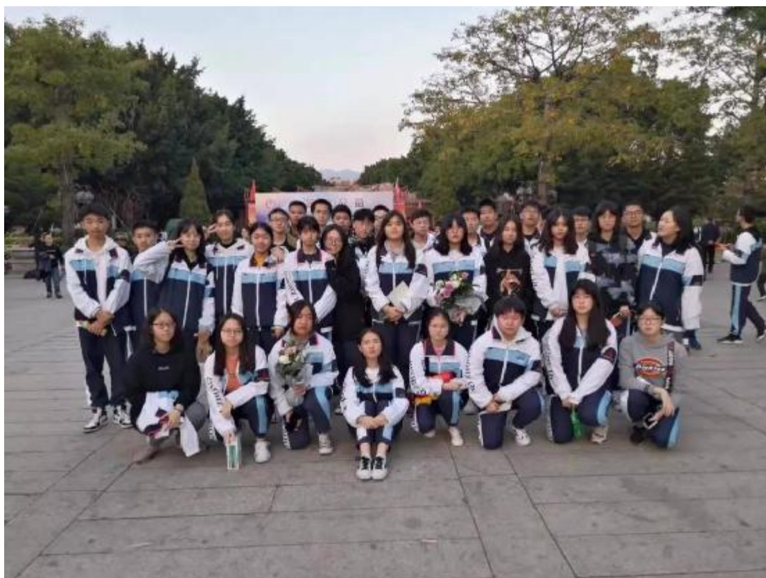
高二 14 班