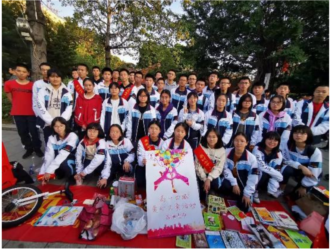
高一 4 班