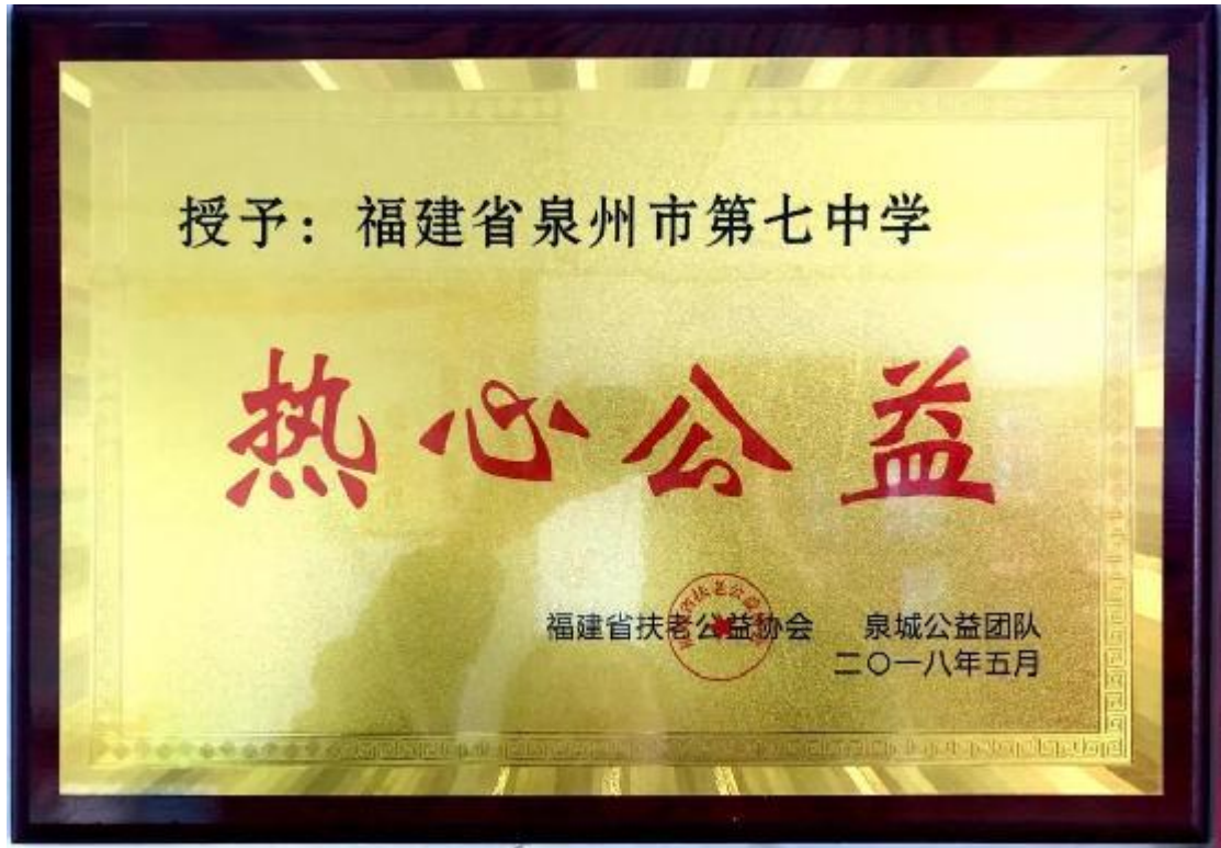
泉州七中被授予“热心公益”称号