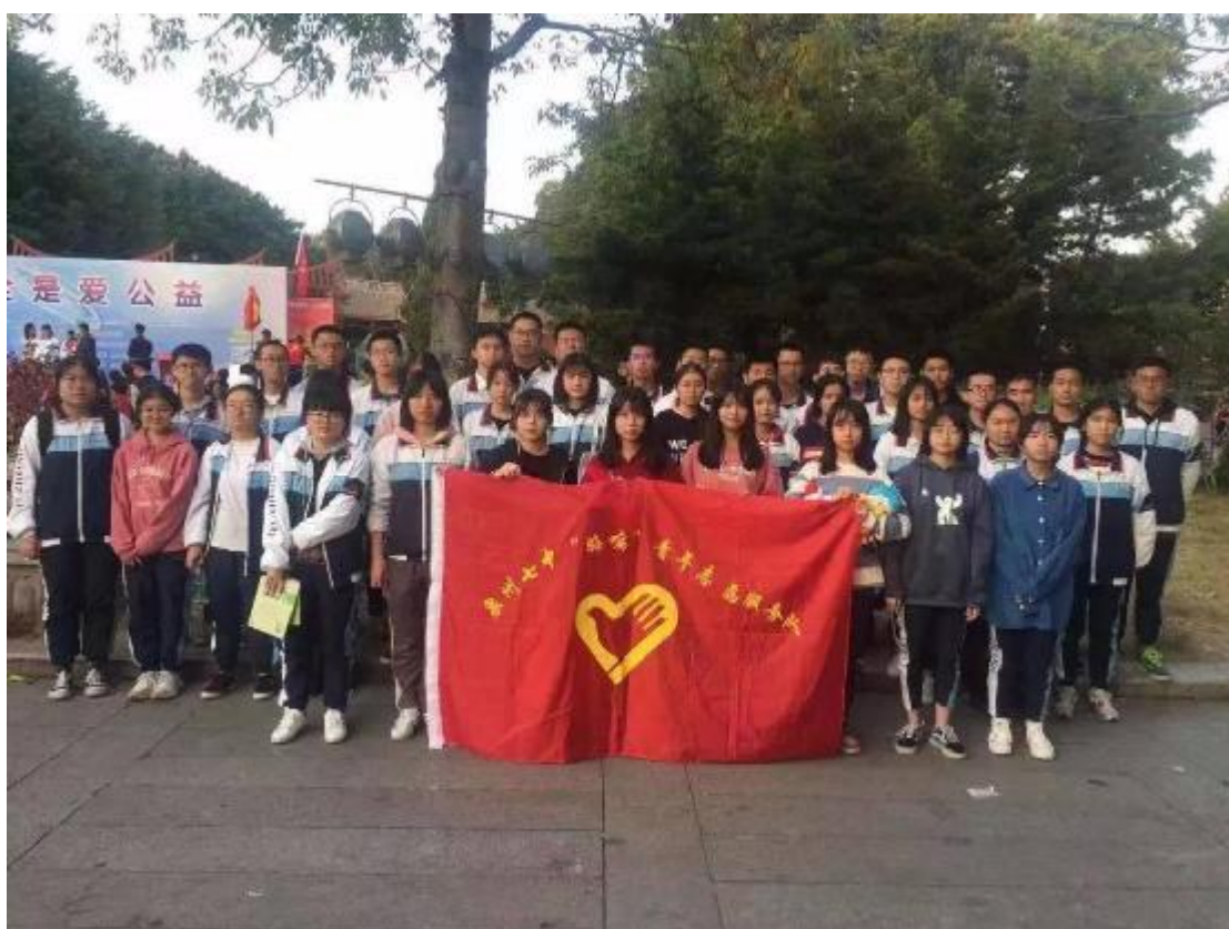
高二 9 班