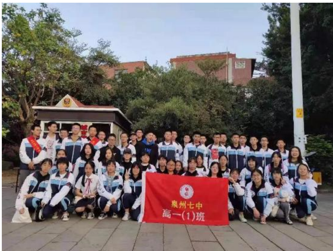
高一 1 班