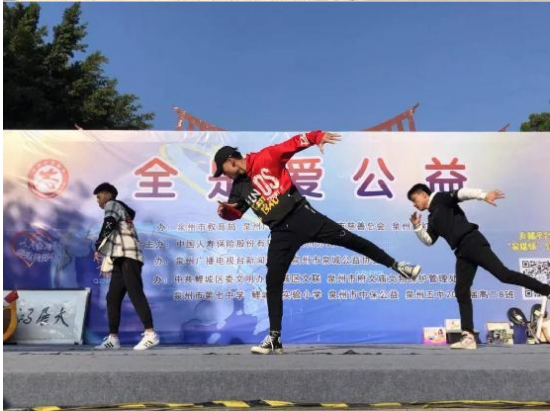
街舞社《sheep》《want you to say》