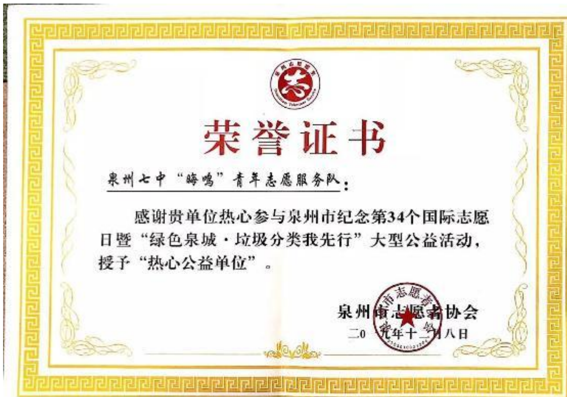
泉州七中“晦鸣”青年志愿服务队被授予“热心公益单位”称号